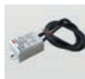
AAA.TRSL15 LED Driver IP66 10W 24V.