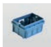
MTS.5428.001 Scatola incasso per Sole. Recessed box for Sole.