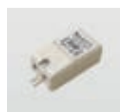
AAA.TRSL14 LED Driver IP20 8W 24V.