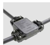
AAA.CN3 Connettore IP68, 3 vie. IP68 waterproof connector, 3 way.