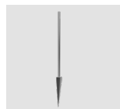
LAA.AS01 Asta h.300mm con picchetto. Rod h.300mm with spike.