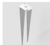
LAA.SP01 Picchetto Inox. Inox Spike.