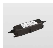
AAA.TRSL13 Driver 70W, IP67. Driver 70W, IP67.