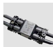
AAA.CN4 Connettore IP68, 4 vie. IP68 waterproof connector, 4 way.