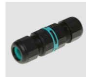
AAA.CN2 Connettore IP68, 2 vie. IP68 waterproof connector, 2 way.