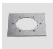
JEL.FR2 Cornice quadrata Square ring.