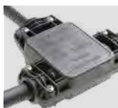
AAA.CN3 Connettore IP68, 3vie. IP68 waterproof connector, 3way.