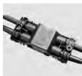
AAA.CN4 Connettore IP68, 4vie. IP68 waterproof connector, 4way.