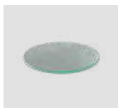
JEL.FG Vetro sabbato Sanded glass.