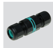
AAA.CN2 Connettore IP68, 2 vie. IP68 waterproof connector, 2 way.