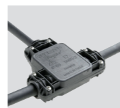
AAA.CN3 Connettore IP68, 3 vie. IP68 waterproof connector, 3 way.