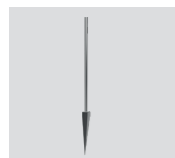
LAA.AS01 Asta h.300mm con picchetto. Rod h.300mm with spike.