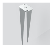
LAA.SP01 Picchetto Inox. Inox Spike.