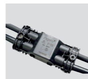
AAA.CN4 Connettore IP68, 4 vie. IP68 waterproof connector, 4 way.