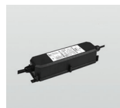
AAA.TRS13 Driver 70W, IP67. Driver 70W, IP67.