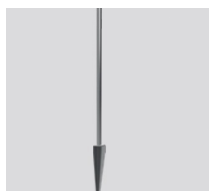
LAA.AS01.000.00 Mini Raggio Spot Asta h. 300 mm con picchetto.

AAA.TRSL13.00 Driver LED constant voltage 24V 70W IP67.