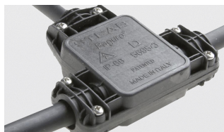
AAA.CN3000.00 Connettore IP68, 3 vie.

AAA.CN2000.00 IP68 waterproof connector, 2 ways.