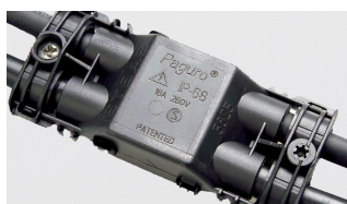
AAA.CN4000.00 Connettore IP68, 4 vie.

AAA.CN3000.00 IP68 waterproof connector, 3 ways.