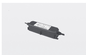
AAA.TRSL13.00 Driver LED 24V 70W IP67

AAA.CN4000.00 IP68 waterproof connector - 4 ways.