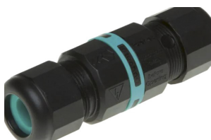
AAA.CN2000.00 Connettore IP68, 2 vie.

AAA.CN2000.00 IP68 waterproof connector, 2 ways.