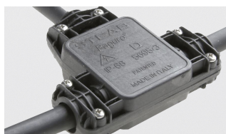
AAA.CN3000.00 Connettore IP68, 3 vie.

AAA.CN2000.00 IP68 waterproof connector, 2 ways.