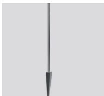
LAA.AS01.000.00 Mini Raggio Spot Asta h. 300 mm con picchetto.

AAA.TRSL13.00 Driver LED constant voltage 24V 70W IP67.